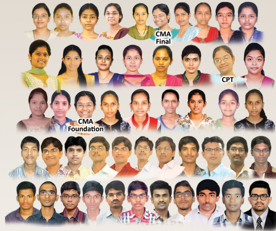
Our students achieved 1st Rank for 49 times in Commerce Courses. Courses include CMA Final, CPT, CMA Foundation, CA IPCC, and CA Inter.

The more you take the more you get from Akshayapatra. Similarly, the more the years the more our All India Ranks in CA / CMA (ICWA) courses.